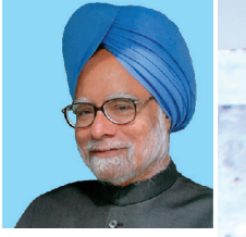
डॉ. मनमोहन सिंह प्रधानमंत्री