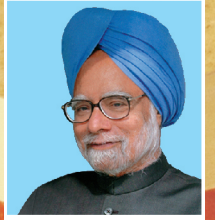
डॉ. मनमोहन सिंह प्रधानमंत्री