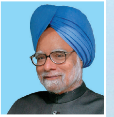
डॉ. मनमोहन सिंह प्रधानमंत्री